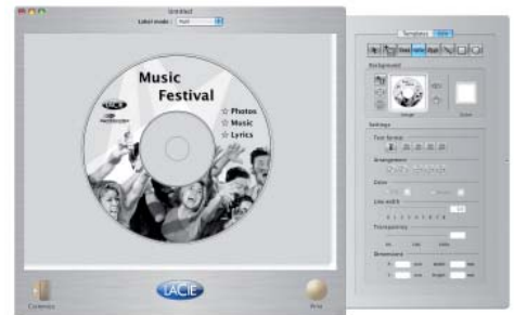
LaCie LightScribe Labeler ソフトウェア