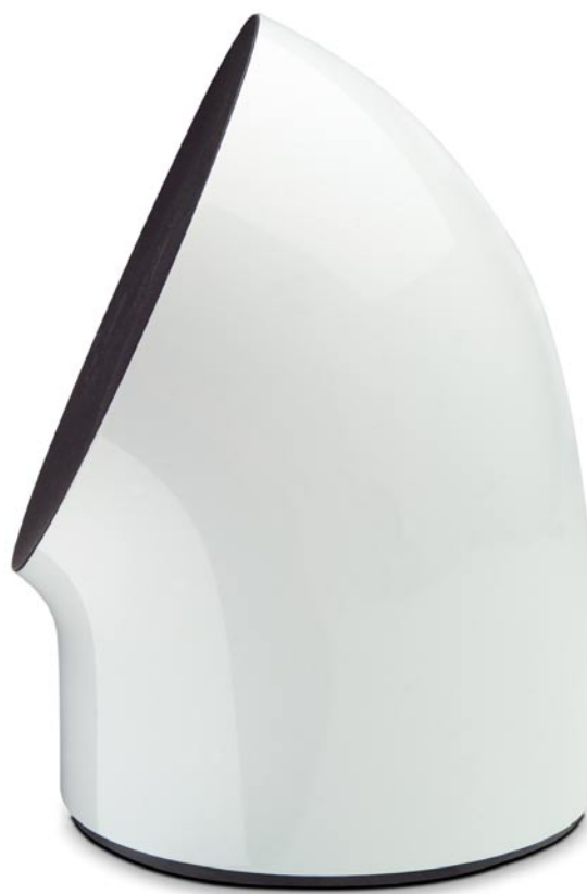
LaCie FireWire Speakers