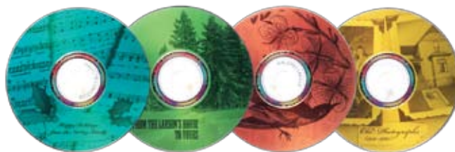
Stampa di etichette per CD/DVD LightScribe Easy