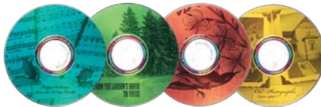
Einfaches Beschriften von CDs/DVDs mit LightScribe