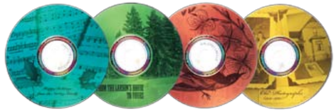
Einfaches Beschriften von CDs/DVDs mit LightScribe