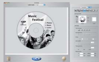
Software LaCie LightScribe Labeler per Mac