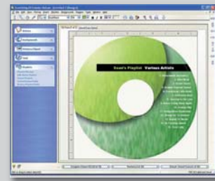
SureThing CD/DVD Labeler für Windows

• Getestet für K3b Version 0.12.14 mit Linux Mandriva 2006/Fedora Core 4/SUSE 10/Ubuntu 5.10 (Software nicht enthalten)