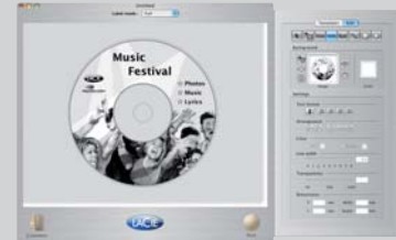
LaCie LightScribe Labeler für Mac