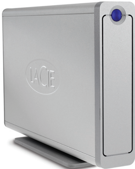
d2 Design by Neil Poulton

Hi-Speed USB 2.0、FireWire 800、FireWire 400