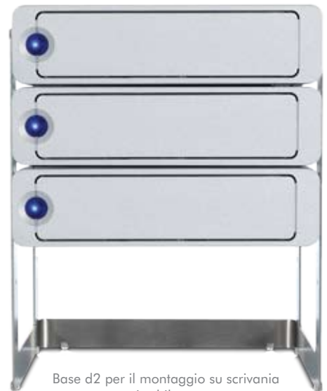
Base d2 per il montaggio su scrivania acquistabile a parte